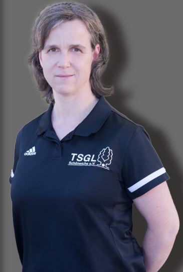
3. Mannschaft U14 / U16