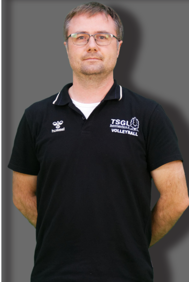
2./4. Mannschaft U18 / U20