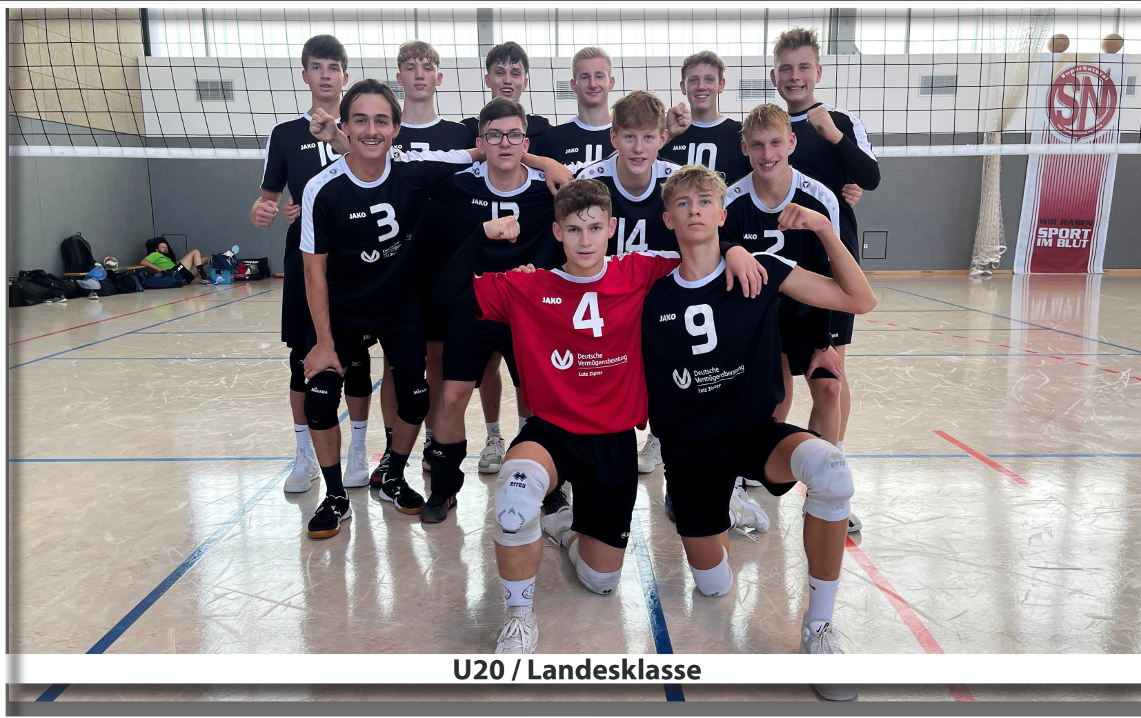
U20 / Landesklasse